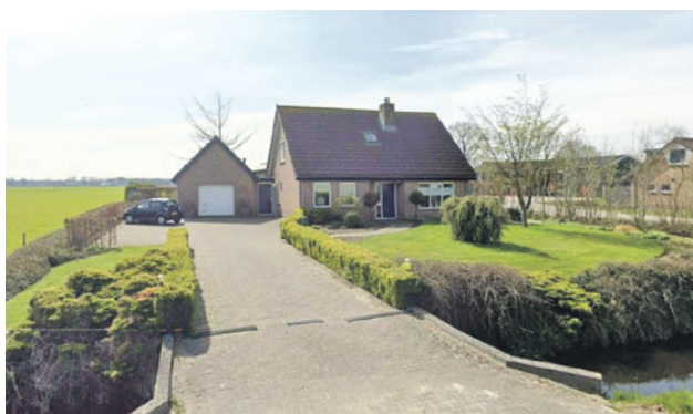
De bedrijfswoning aan de Zeldertseweg 79 in Hoogland.

Er is een aanvraag gedaan om de bedrijfswoning aan de Zeldertseweg 79 om te zetten naar een plattelandswoning. De woning mag dan niet meer gebruikt worden als bedrijfswoning en mag zelfstandig bewoond worden. Het plan past niet in het bestemmingsplan. Om de omgevingsvergunning te kunnen verlenen, is daarom een uitgebreide vergunningsprocedure nodig. Het college vraagt de gemeenteraad een ontwerpverklaring van geen bedenkingen af te geven. Hiermee geeft de gemeenteraad aan geen bezwaar te hebben tegen de plannen. Na vaststelling worden de ontwerpomgevingsvergunning en de ontwerpverklaring van geen bedenkingen zes weken ter inzage gelegd. Belanghebbenden kunnen dan zienswijzen (officiële reacties) indienen. Als er geen zienswijzen zijn, wordt de vergunning verleend. Als er wel zienswijzen zijn, legt het college in een voorstel aan de gemeenteraad voor hoe hiermee om te gaan.