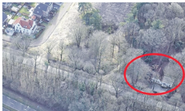
De huidige situatie Laan 1914 17 (foto: gemeente Amersfoort).

De eigenaar van het perceel aan Laan 1914 nummer 17 heeft een voorstel ingediend om twee woningen onder één kap te bouwen om de huidige vrijstaande woning te vervangen. In het plan wordt rekening gehouden met de bosachtige omgeving en de bomen op het perceel. Het nieuwe bestemmingsplan beperkt de mogelijkheden om vergunningsvrij bijgebouwen te bouwen. Dit om versterking van het perceel tegen te gaan. In mei 2022 heeft de gemeenteraad besloten de zogenaamde coördinatie-regeling toe te passen. Hierdoor werden de procedures voor het bestemmingsplan en de omgevingsvergunning tegelijk doorlopen. Het ontwerpbestemmingsplan en de ontwerpomgevingsvergunning hebben zes weken ter inzage gelegen. Er zijn geen zienswijzen (officiële reacties) ingediend. Het college vraagt de gemeenteraad nu het nieuwe bestemmingsplan vast te stellen. Na de vaststelling wordt het bestemmingsplan zes weken ter inzage gelegd. Belanghebbenden kunnen dan een beroepschrift indienen.